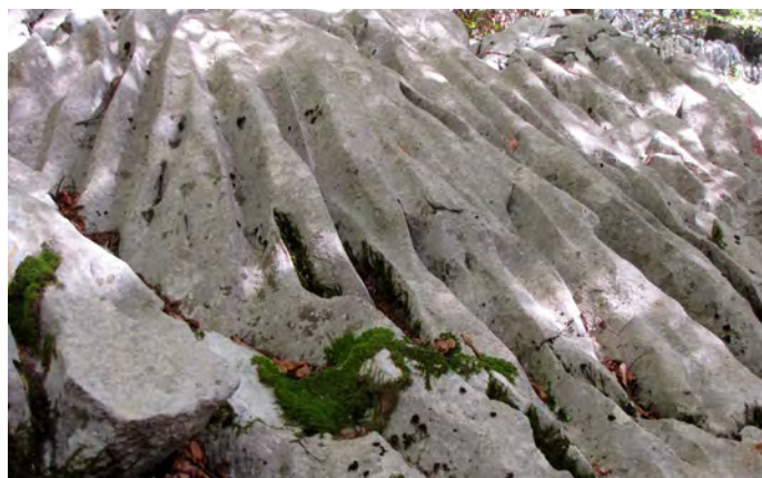
Los lapiaces de Itxina muestran morfologías de disolución muy vistosas

LATITUD. 43° 04' 20.93" LONGITUD. 2° 49' 07.31" X. 514.757.96 Y. 4.768.881.38 NIVEL. 13