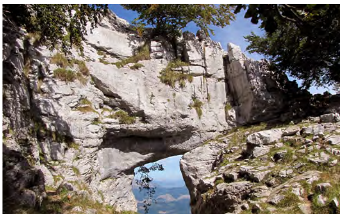
Ojo de Atxular