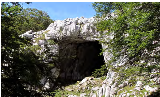
Cueva de Supelegor